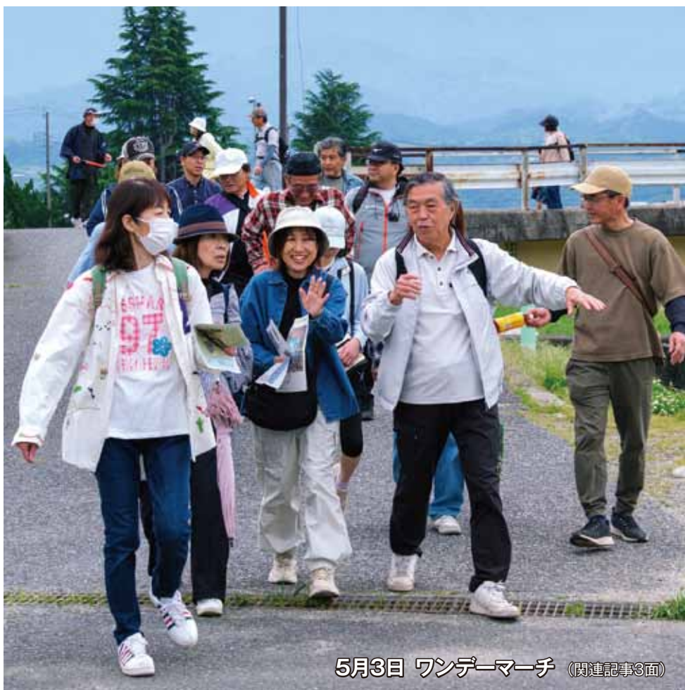
5月3日 ワンデーマーチ (関連記事3面)