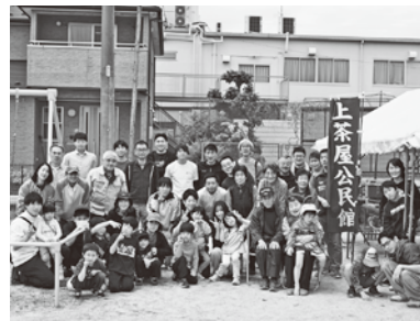
5月3日に本年度文化