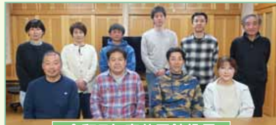
令和7年度公民館役員