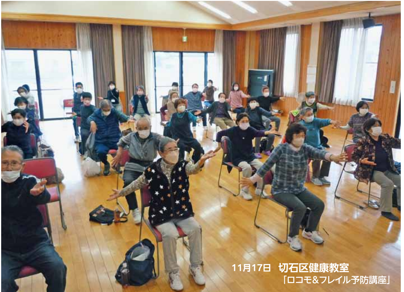
11月17日 切石区健康教室 「ロコモ&フレイル予防講座」

令和6年9月30日現在 切石区の人口 2,211人(男性 1,074人 女性 1,137人) 組合加入 593戸(世帯数 920戸)