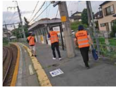
8月4日 切石区防犯パトロール 夏と冬の年2回 生活安全全部が区内をパトロール