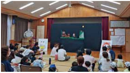
8月3日 人形劇フェスタ切石会場