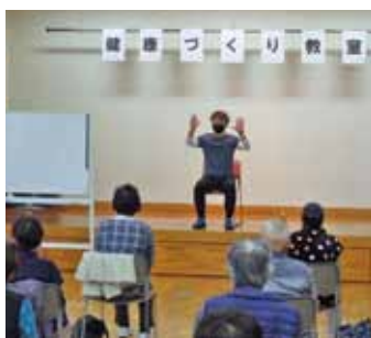
11月17日 健康づくり教室