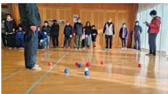
1月19日 班対抗ポッチャ大会