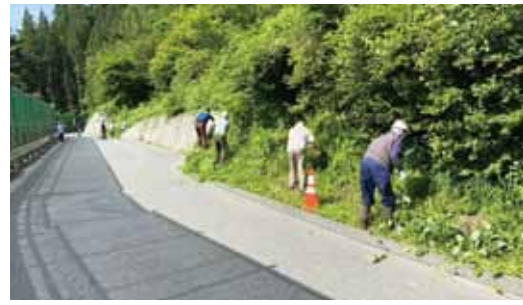
7月7日 妙琴公園管理作業 切石区建設山林部、切石区役員の27名が参加