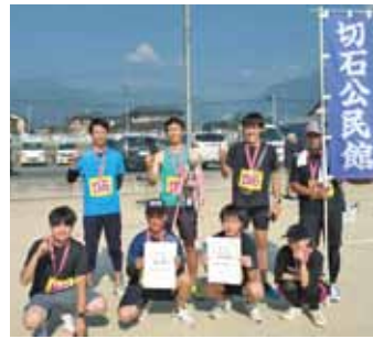
9月8日 鼎駅伝 切石分館チーム優勝