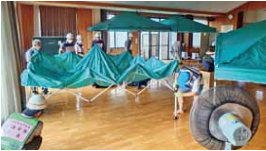
9月1日 切石区防災訓練 飯田市の防災訓練は台風の影響で中止となりましたが、切石区では自主防災会役員で訓練を実施