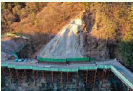
トンネル坑口の状況

13年夏工事完了の見通しであることが昨年9月に開かれた住民説明会で明かされました。これにより市道大休妙琴線を走る工事用車輛の運行期間も延長されます。リニア対策委員会では引き続き切石区を通る工事用車輛の安全運転遵守を要請していきます。