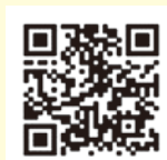
県ホームページ (切石のページ)

広報きりいしの発行は年2回ですが、ホームページは、いつでも最新の情報を見られるので、ぜひ一度ご覧ください。