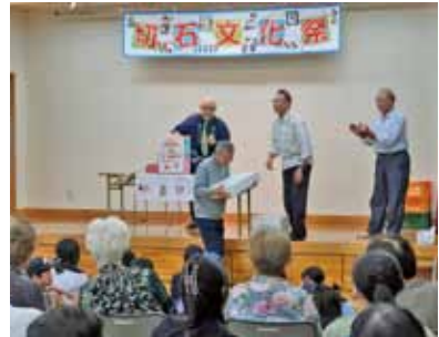
10月13日 切石文化祭&秋まつり