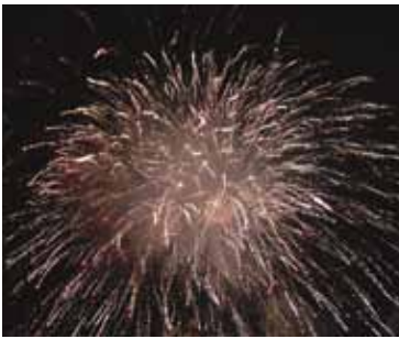
9月29日 天伯八幡神社秋季祭典 奉納煙火