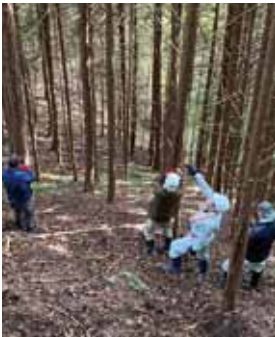
11月11日 切石区有林(うご洞)の立木調査