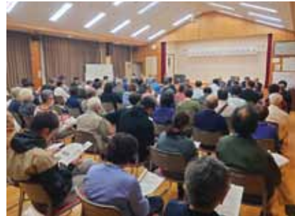
10月24日 切石区自治会組長会