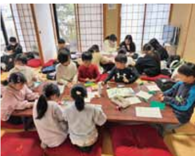
12月26日 冬休み 小学生の集い