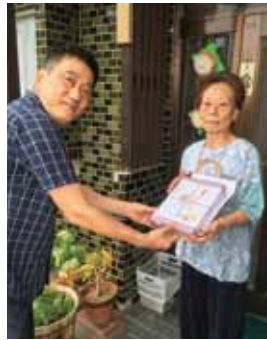
9月16日 敬老祝賀記念品贈呈 本年度80歳になられた18名に記念品を贈呈