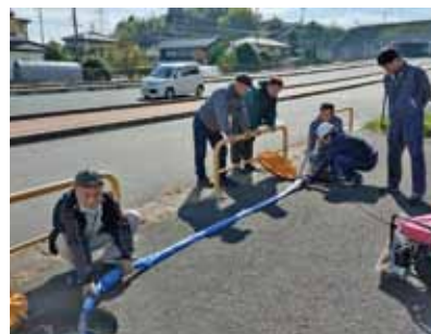
11月11日 切石区防災訓練(給水訓練)