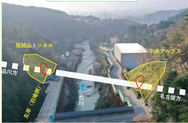
トンネル坑口部の状況

妙琴公園からの発生土は黒田工区、下久堅へ工事用材料として運搬されています。工事用車両は市道大休妙琴線を上り、工事用仮橋を使って松川を渡り、県道飯田南木曾線を下るワンウェイで運行しており、5月は片道210台/日(月最大)の通行台数となっています。